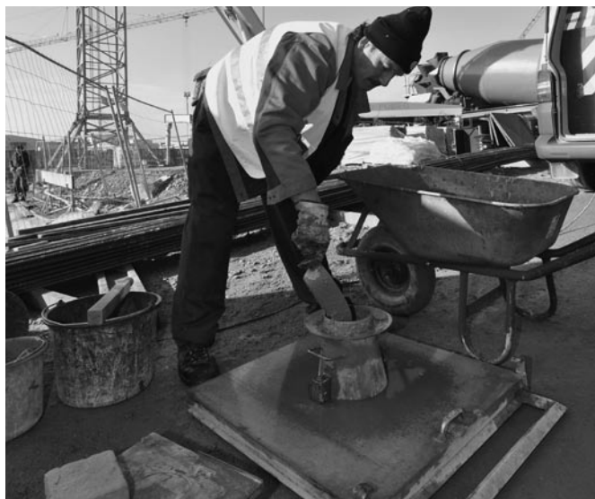
Bild 2: Auf der Baustelle wird u.a. die Frischbetonkonsistenz geprüft.

Nach Beendigung der Bauarbeiten sind die Ergebnisse aller Prüfungen nach Tafel 2 an den Betonen der Überwachungsklassen 2 und 3 der überwachenden Behörde und der Überwachungsstelle zu übergeben.